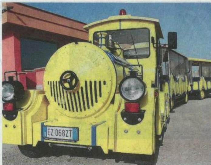
Il trenino turistico

●●● Da ieri è entrato in servizio il trenino turistico ma anche i sensi unici di marcia sul litorale di Tonnarella. Rispetto allo scorso anno si registrano delle variazioni. Sarà l'Autoservizi Siberiana di Mazara del Vallo, senza costi per il Comune, a garantire per il periodo estivo il servizio di trenino turistico gommato. Lo ha deciso l'Amministrazione Comunale, accogliendo la proposta della società cooperativa che già gestisce il servizio di trasporto pubblico urbano, in considerazione del fatto che il servizio integrativo di trenino turistico gommato, già sperimentato con successo negli anni passati, non avrà alcun costo per il Comune. L'Autoservizi Siberiana introiterà interamente il ricavo dei biglietti, i cui costi sono stati predeterminati dal Comune. Si pagherà un euro al giorno senza limite di corsa dalle ore 9 alle ore 13,30 e dalle ore 15,30 alle ore 19 (conservando il biglietto fino alle ore 19 sarà pertanto possibile fruire di più corse nel servizio giornaliero che prevede il percorso dal capolinea "Lungomare San Vito Rotonda" sino a Tonnarella al