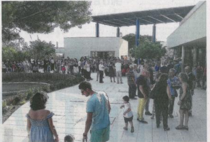
Folla ieri mattina per l'inaugurazione del nuovo ingresso, da Triscina, del Parco archeologico di Selinunte.

Il nuovo ingresso è a due passi dai Santuari delle divinità, la zona della Malophoros e della Gaggera che, spesso, rimanevano fuori dai consueti circuiti turistici perché lontani dalla collina orientale e dall'Acropoli. Ora il Parco archeologico di Selinunte lo si potrà scoprire anche in quelle zone rimaste, per decenni, in ombra e senza sentieri. Per la prima volta nella storia del Parco più grande d'Europa ieri è stato inaugurato un secondo varco d'ingresso, stavolta con accesso dalla frazione di Triscina al lato opposto a quello dentro la città di Marinella. Un taglio del nastro dopo tante vicissitudini: un primo stralcio di lavori nel